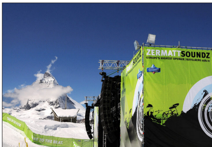
Das «Zermattsoundz» lockte 2500 Besucher in den Schnee.

Smudo von den «Fantastischen Vier» war vom Matterhorn begeistert: «Der Berg ist massiv.» Das «Zermattsoundz» ging zum ersten Mal über die Bühne.