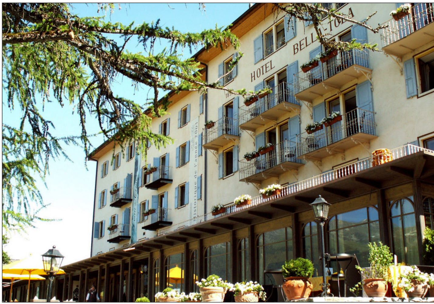
Die Mitglieder der Swiss Historic Hotels trafen sich am Wochenende zur Generalversammlung im Hotel Bella Tola im Val d'Anniviers.