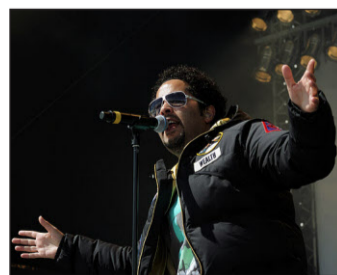
Adel Tawil von «Ich+Ich» begeisterte auf 2580 Metern.

schon Kraftakt vollbrachte die Zermatt Bergbahnen AG. Gemeinsam mit der Matterhorn Gotthard Bahn und der Gornergrat Bahn stimmten sie 80 Tonnen Material von Visp auf den Riffelberg. «Die Fantasti-